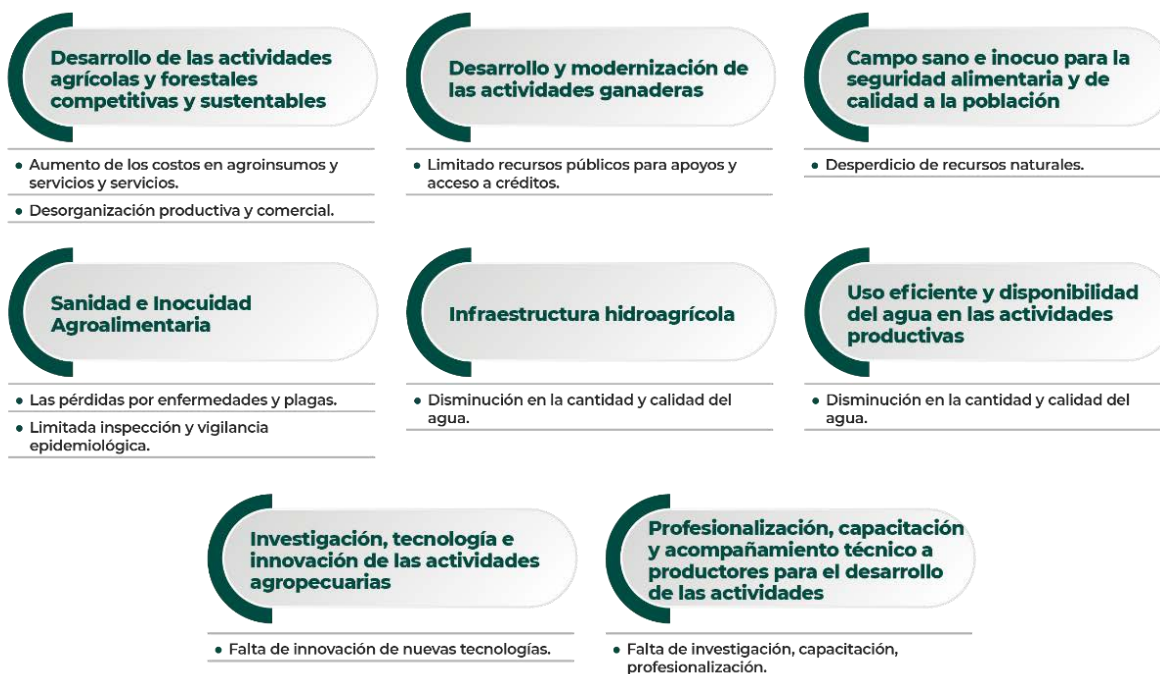
Esquema 2. Esquema de correlación del árbol de problemas (causas) con la estructura temática que dará atención