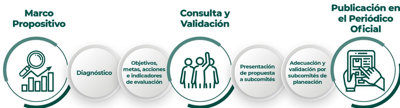
Imagen 1. Etapas del proceso de formulación del Programa Sectorial de Desarrollo Agropecuario y Rural 2022-2027

Fuente: Elaborado por la Secretaría de Agricultura y Desarrollo Rural BC.